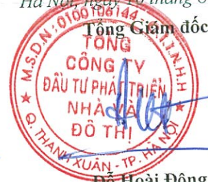
Đỗ Hoài Đông