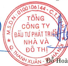
Đỗ Hoài Đông